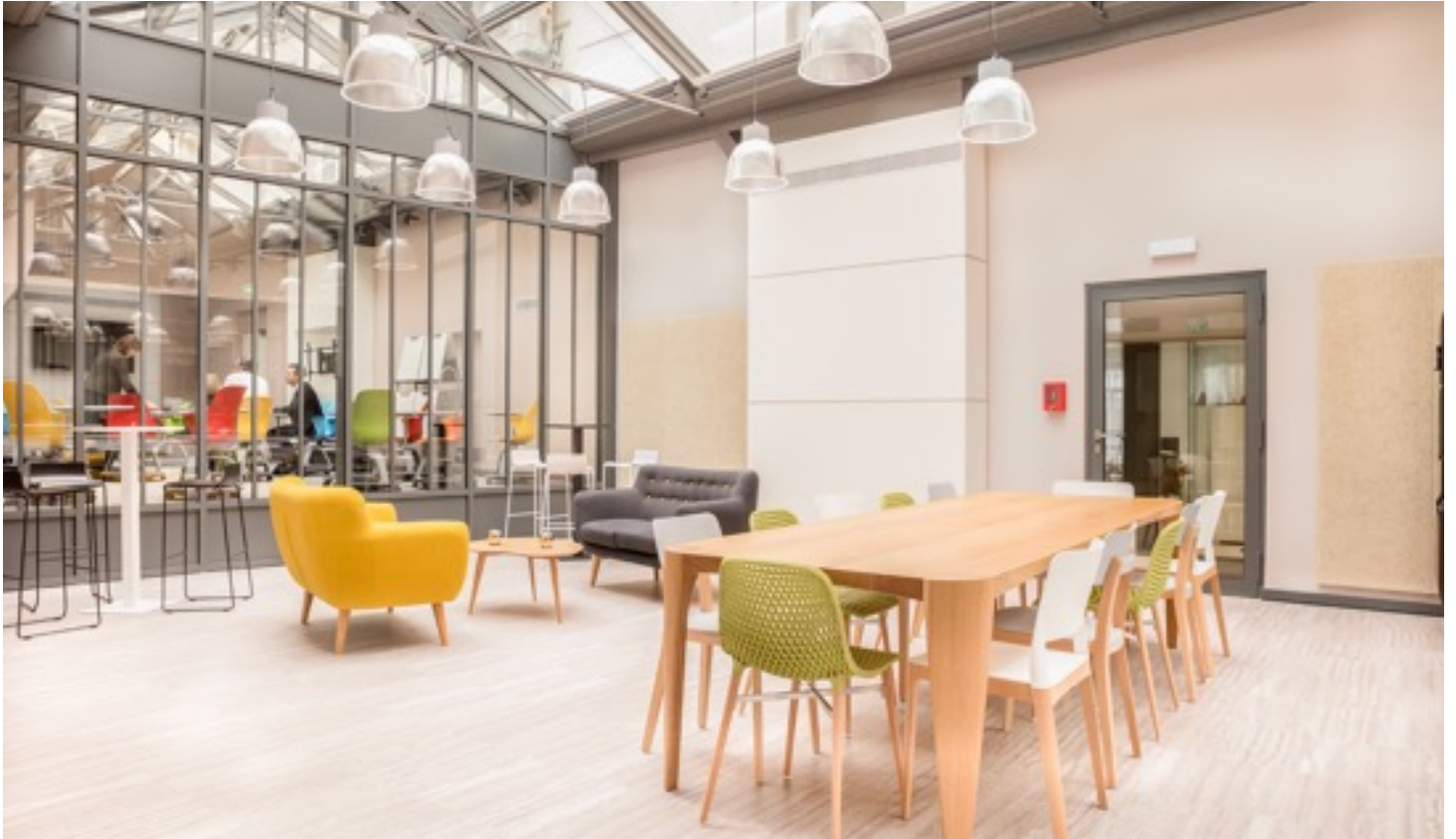
Bureaux Galeries Lafayette par Cider Groupe

L'organisation et le design (au sens premier du terme : Esthétique industrielle appliquée à la recherche de formes nouvelles et adaptées à leur fonction) de votre workplace peut aussi avoir un impact direct sur la productivité et la créativité de vos équipes. Lors de la création du nouveau siège d'Apple, sa forme et la manière de circuler ont été pensés pour créer des rencontres. C'est la fameuse sérendipité qui est si difficile à reproduire à distance.