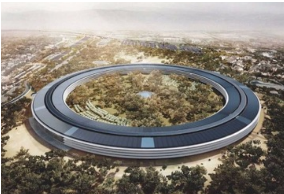
Applepark - Apple

La réflexion sur le design de votre workplace est un sujet incontournable pour votre entreprise, même en 2021.