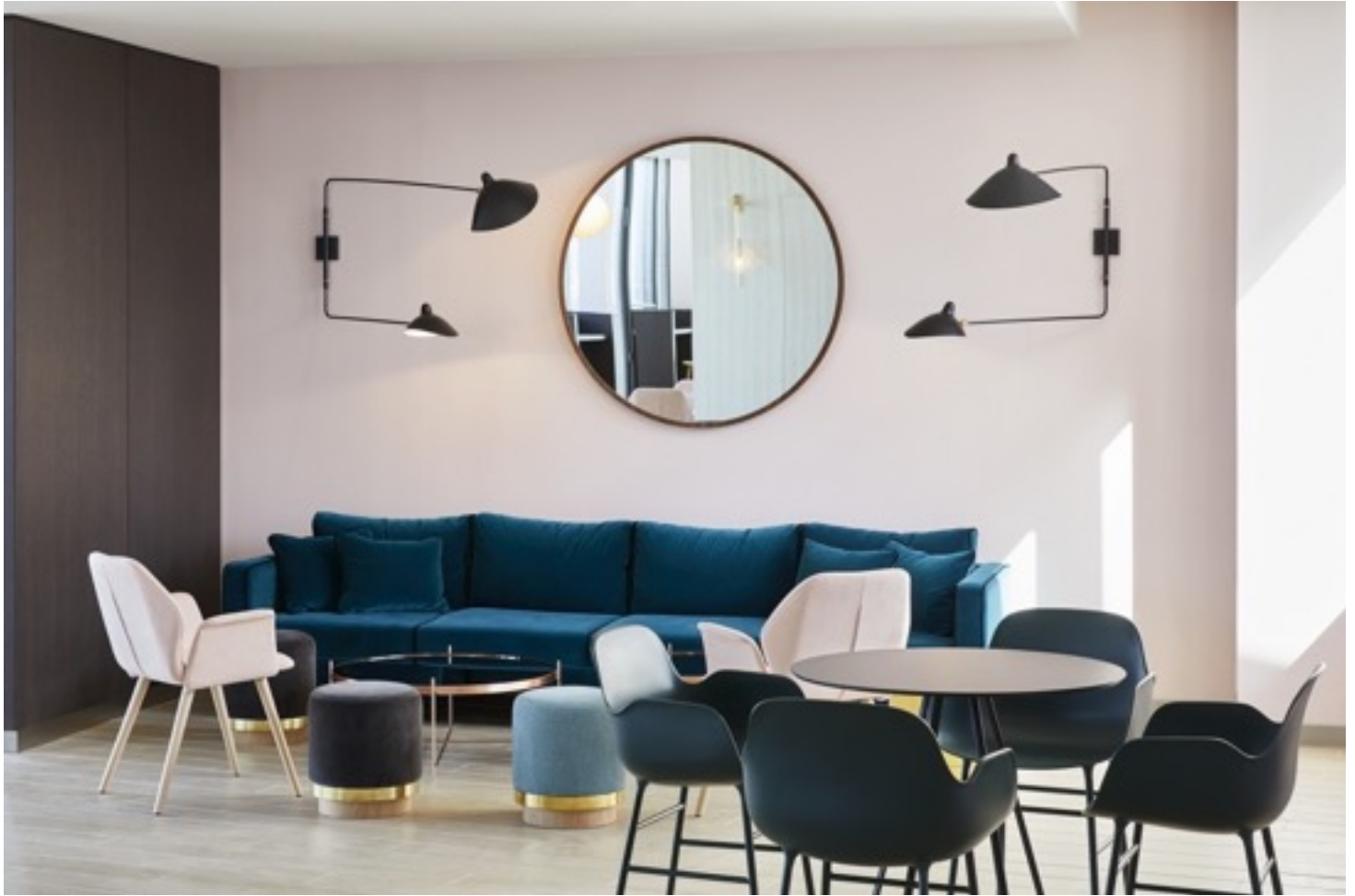
Bureaux L'Oréal par Sarah Lavoine